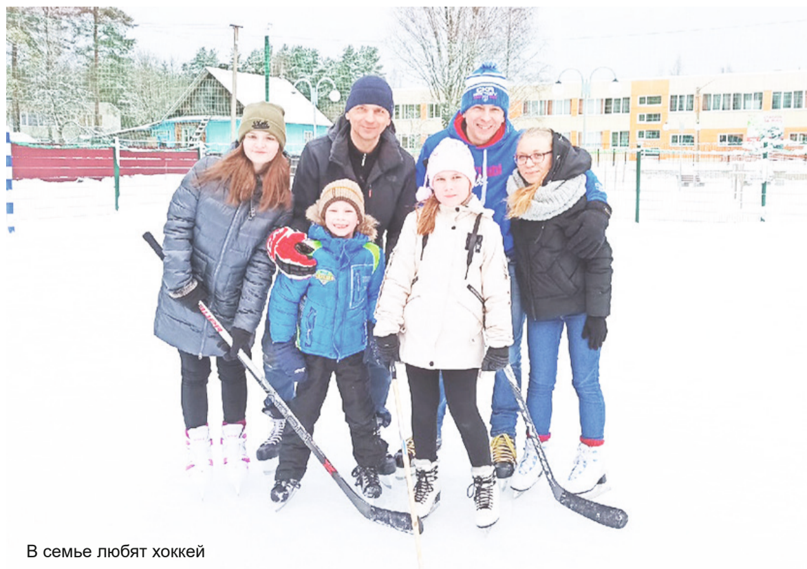
В семье любят хоккей