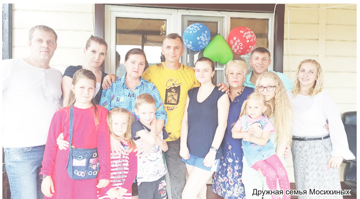
Дружная семья Мосихиных

У меня там столько огурцов, помидоров, перцев, баклажанов! Сама не ожидала – сажаю-то первый год. Какое счастье! Выгляну в окошко: гладиолусы, георгины,