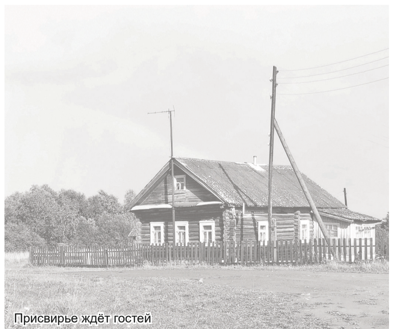
Присвирье ждёт гостей

от необходимости учитывать протяжённость трасс, количество жителей в районе и соответствующую нагрузку на дорожное полотно с учётом транзита. Например, губернатор предположил, что дороги Гатчинского района, по которым проезжает до 18 тысяч автомобилей в сутки, в большинстве своём требуют более толстого асфальтобетонного покрытия, чем в Подпорожском, где нагрузка на дорожное полотно не превышает двух тысяч автомобилей в сутки. Однако, используя новые подходы и технологии ремонта