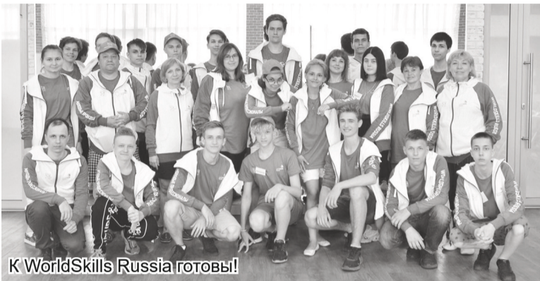
К WorldSkills Russia готовы!

Студенты Подпорожского политеха – в составе сборной Ленинградской области примут участие в Финале IX Национального чемпионата «Молодые профессионалы (WorldSkills Russia)», который пройдёт с 25 по 29 августа 2021 года в городе Уфе Республики Башкортостан.