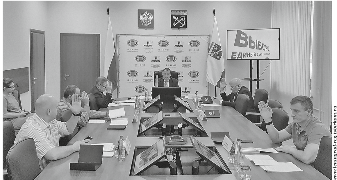
На заседании Леноблизбиркома

Проголосовать на дому можно по уважительным причинам, таким как состояние здоровья, инвалидность и т. д. Для этого нужно подать заявление в участковую избирательную комиссию с 9 сентября до 14 часов 19 сентября. Сделать это можно письменно, по телефону, через других лиц или через портал «Госуслуги».