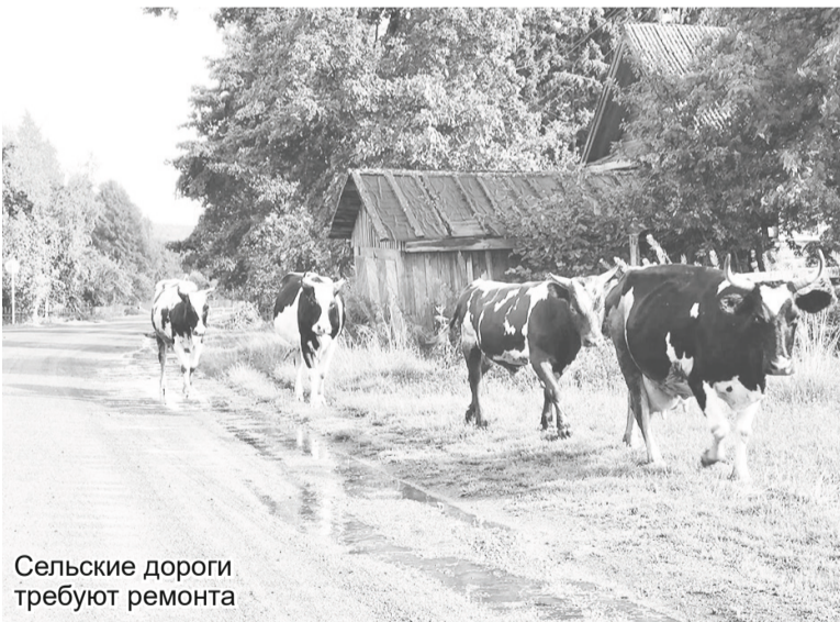
Сельские дороги требуют ремонта

В частности, Денис Станиславович напомнил основные задачи своего ведомства по содержанию и ремонту сети региональных дорог и принципы распределения субсидий для муниципальных властей из регионального дорожного фонда. Председатель дорожного комитета отметил, что ежегодно на субсидии выделяется около полутора миллиардов рублей. Губернатор Александр Дрозденко по этому поводу добавил, что содержание муниципальных дорог – это обязанность районных властей, независимо